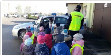
Niechronieni Uczestnicy Ruchu Drogowego na terenie gminy Brzeżno