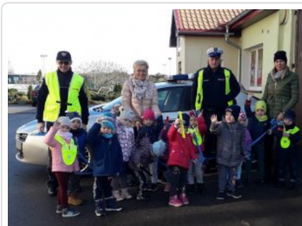
Niechronieni Uczestnicy Ruchu Drogowego na terenie gminy Brzeżno