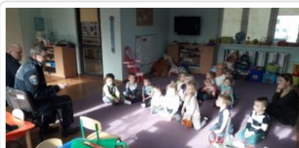
Niechronieni Uczestnicy Ruchu Drogowego na terenie gminy Brzeżno