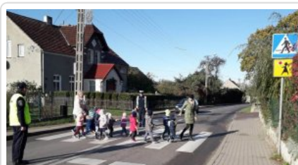
Niechronieni Uczestnicy Ruchu Drogowego na terenie gminy Brzeżno