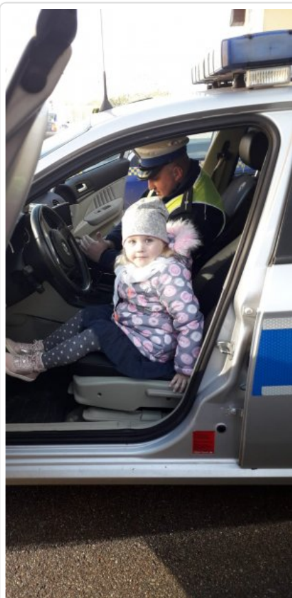
Niechronieni Uczestnicy Ruchu Drogowego